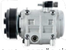
A/C KOMPRESÖR SİSTEMİ 12 KW